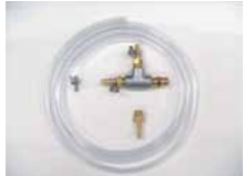
本体ドレン入口継手 本体ドレン出口排出ホース・継手 標準取付部品（詳細は取説参照）