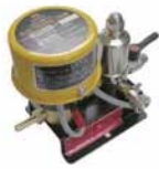
電子トラップ UP155-2E (AC200V)

タンク内のドレンをモーターが起動する度ごとにPSD8型内にドレンを送り込み清水にします。