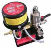
オートエアートラップ P1-2HE (AC200V)

タンク内のドレンをモーターが起動する度ごとにPSD8型内にドレンを送り込み清水にします。