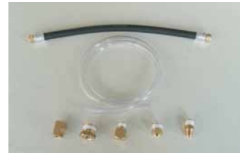
タンクとトラップを接続する 標準取付部品

タンク内のドレンを15分間毎に5秒間（可変）PSD8型内にドレンを送り込み清水にします。